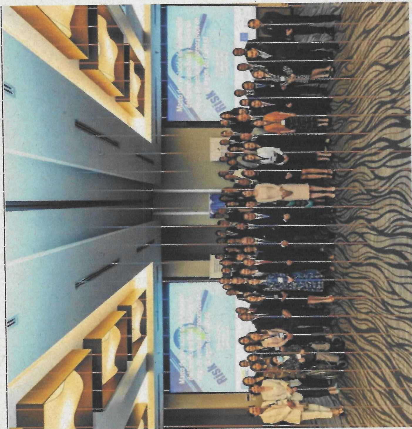
Imagen de los facilitadores, autoridades del Grupo de Acción Financiera, del Gobierno de Panamá y de los participantes de distintas delegaciones de distintos países Latinoamericanos